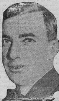
Edwin Rudolph, de Chicago, quien acaba de ganar en Nueva York el campeonato mundial de billar, derrotando a Ralph Greeleaf por 125 contra 121