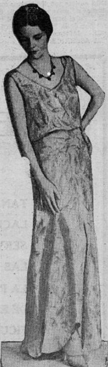
Este elegante y sencillo traje de etiqueta en brocado oro y blanco ha merecido muchos elogios. Las zapatillas son de moiré verde con oro